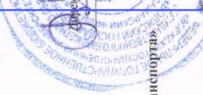
График учебного процесса Федерального государственного образовательного учреждения высшего образования «Волжский государственный университет водного транспорта» Самарского филиала на 2022 - 2023 учебный год